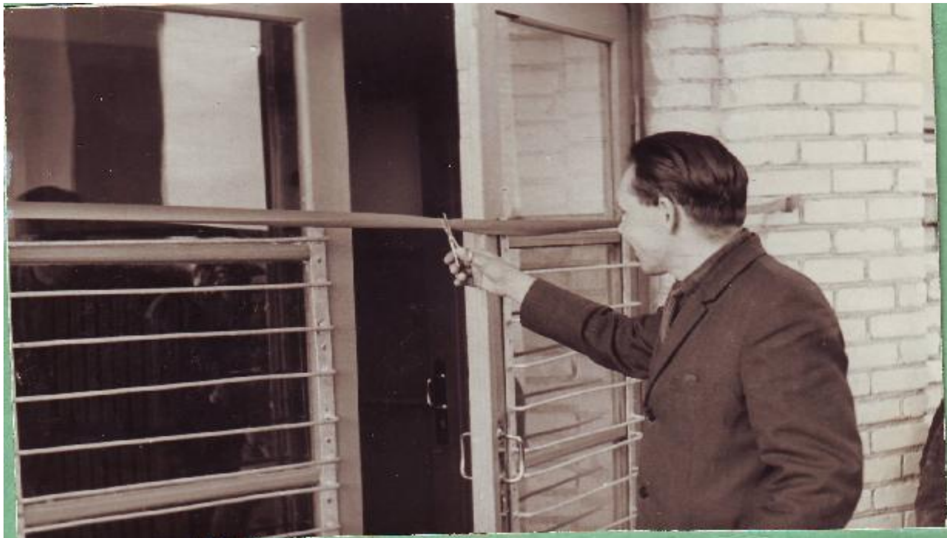
Торжественный момент открытия нового здания Остроленской средней школы. Ноябрь 1967 года.