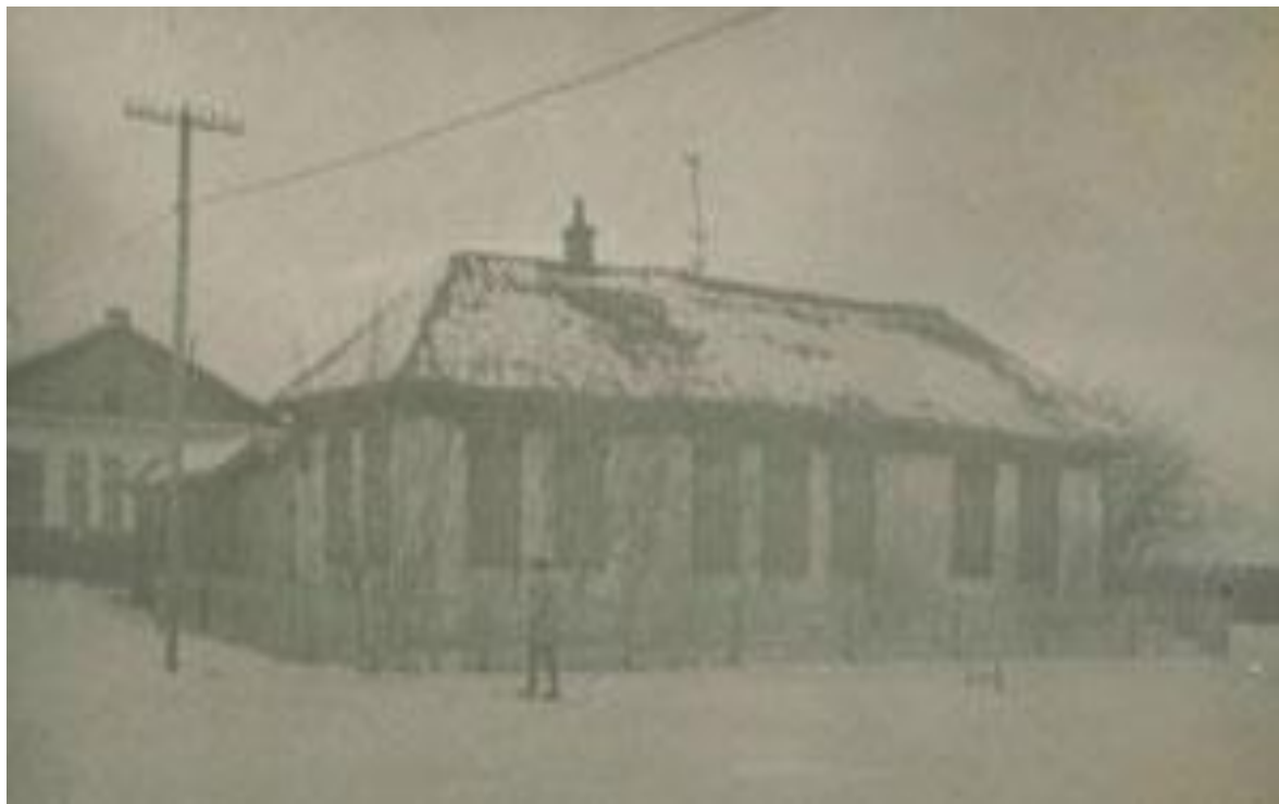
Фотографии двух из четырёх зданий школы