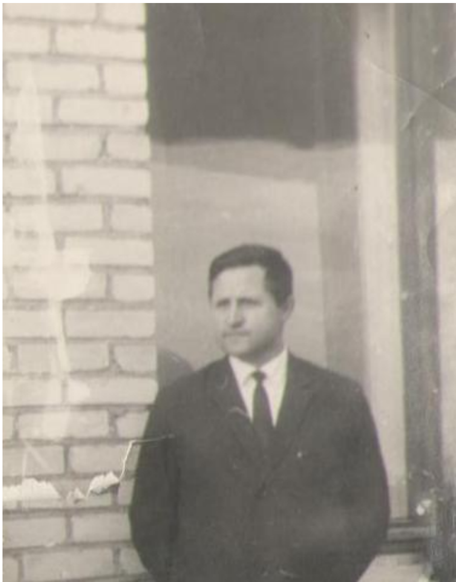
Корсаков Вениамин Игнатъевич