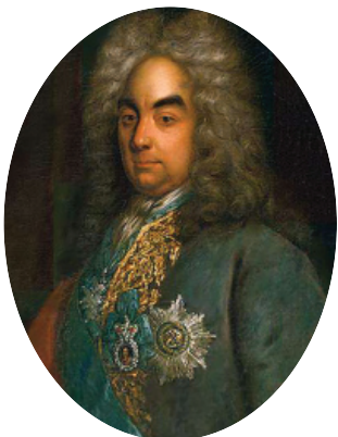
Петр Андреевич Толстой