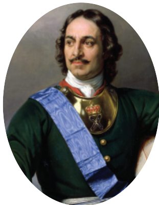
Император Петр I

Сообщениями «о похищении казны» первоначально занималась тайная канцелярия во главе с графом П.А. Толстым. И работала она на совесть. Но были и такие дворяне и чиновники, которые к проблеме мздоимства относились гораздо терпимее. По рассказам современников, однажды в Сенате Петр пригрозил издать указ, по которому всякий, кто украдет у казны сумму, на которую можно купить веревку, будет повешен. Генерал-прокурор Ягужинский на это заметил: «Неужели вы хотите остаться императором без служителей и подданных? Мы все воруют — с тем только различием, что один больше и приметнее, чем другой».