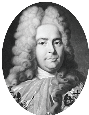
Генерал-прокурор Павел Иванович Ягужинский